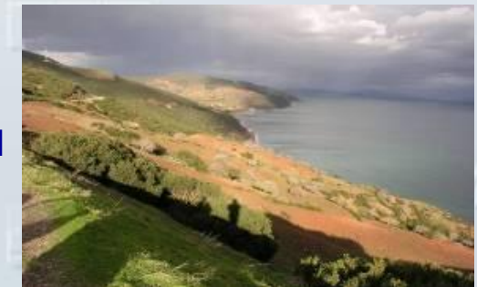
Maroc : Rif central