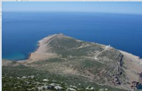
Tunisie : Cap Bon