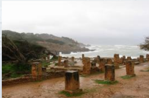
Algérie : Mont Chenoua - Cap Djinet